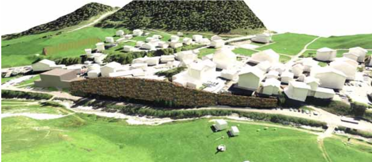
Skizze Damm Piz Ot

Das AWN schätzt das gesamte Investitionsvolumen derzeit sehr grob zwischen CHF 12.5 – CHF 15.0 Mio. ab (ohne Zweitnutzung). Der umfassende Planungsprozess für die Ausarbeitung eines bewilligungsfähigen Bauprojektes wird einen Projektierungskredit von rund CHF 750'000.00 erfordern, welcher in verschiedene Planungsphasen (Phase 21 - 32 nach SIA 112) aufgliedert ist. Die Planungsaufträge wären somit etappiert, wodurch der Planungsprozess gestoppt werden könnte, sofern keine mehrheitsfähige Lösung erarbeitet werden kann.