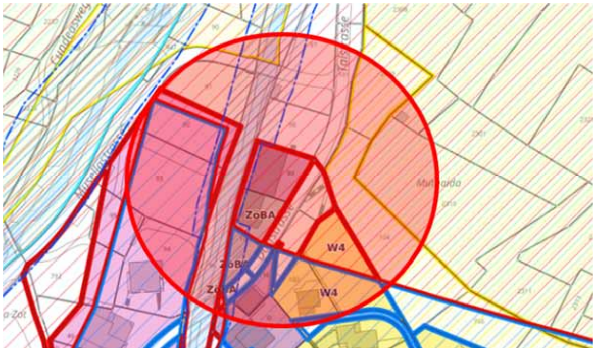
Ausschnitt Stand Zonenplan

Das Amt für Wald- und Naturgefahren (AWN) hat im Auftrag der Gemeinde Samnaun ein Bauprojekt für einen Ablenkdamm im Gebiet Motnaida ausgearbeitet, durch welchen die Grundstücke rund um das Chasa Riva geschützt wären. Dieses Projekt wurde im Gemeinderat bereits verschiedentlich beraten und der Bevölkerung an der Informationsveranstaltung vom 4. April 2023 von Vertretern vom Amt für Wald und Naturgefahren und der Gefahrenkommission III vom Kanton Graubünden im Detail vorgestellt.