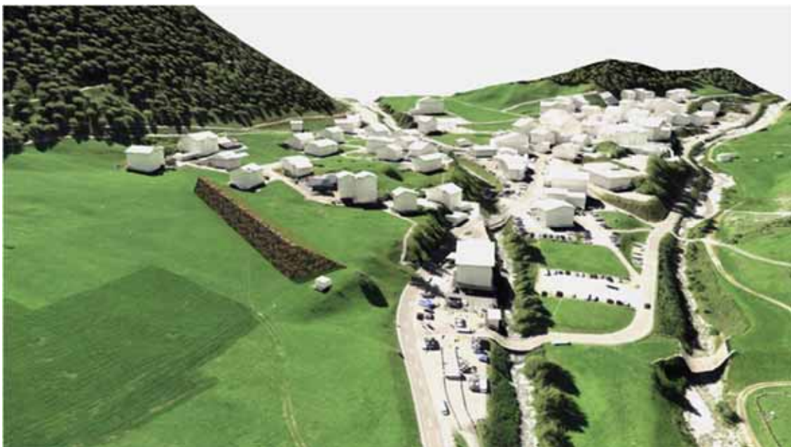
Skizze Damm Motnaida

Der Ablenkdamm Motnaida weist eine Länge von rund 110 m und eine Höhe von bergseits 8 m, in der Mitte von 10 m und talseits 12 m auf. Auf der Lawinenseite wird der Damm mit Blocksteinen von Samnaun (Alp Trida Steinen) ausgeführt. Die Dammkrone ist 2 m breit. Auf der Rückseite wird eine mähbare Böschung in der Neigung 2:3 aufgeschüttet. Eine flachere Böschung ist aufgrund der nötigen Materialbeschaffung nicht möglich. Für die nötige Parzellenbeanspruchung ist mit den Eigentümern noch ein entsprechendes Servitut (Baurecht) abzuschliessen.